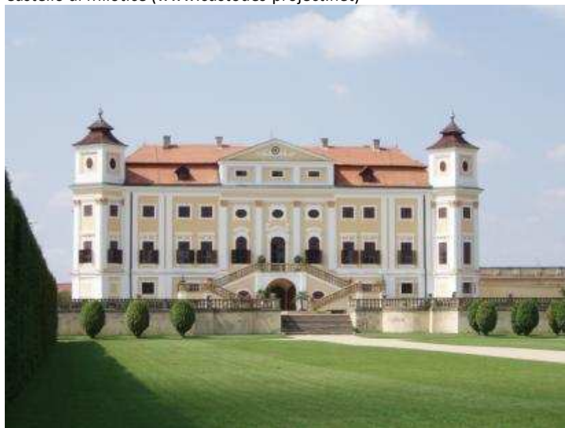
Castello di Milotice

L'atmosfera di questa regione è caratterizzata dalle rive sinuose del fiume Moravia, dalla foresta pluviale e dalle vigne sempre verdi. I siti culturali più visitati sono gli insediamenti Slavi a Mikulčice , che riportano i visitatori all'epoca della Grande Moravia di circa 1000 anni fa, i castelli di Hodonín e Strážnice, il museo all'aria aperta di Strážnice e altri numerosi monumenti sacri tra cui chiese e cappelle. Emergono inoltre la torre di guardia Tvarožná, il mulino di Starý Poddvorov e il villaggio nell'area monumentale di Petrov – Plže (un famoso villaggio con caratteristiche cantine poste sui colli). I visitatori sono attratti non solo dai siti culturali di questa zona, ma anche dai diversi eventi che animano l'intera regione tutto l'anno come festival e fiere, che danno la possibilità di incontrare la vera tradizione popolare locale. Gli eventi più famosi sono le festività di St. Vavřinec, la Festa Imperiale e la Celebrazione del Vino a Hodonín, la corsa su strada "Great Moravia" a Mikulčice, il Festival Musicale di Primavera a Dolnín Bojanovice e il Festival Internazionale del Folklore a Strážnice.